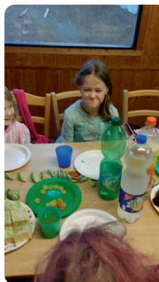
Foto links: Gewinnerin Schaumküssewettessen Foto rechts: Schaumküssewettessen