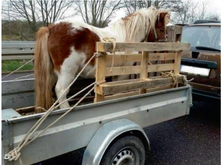
Auf diesem Anhänger wurde das Pony transportiert. Ein klarer Verstoß gegen die Ladeverordnung.

In Magdeburg stand ein Pony auf einem offenen Anhänger, nur mit einigen Spanngurten und Seilen gesichert. Mit Paletten waren mehr als notdürftige Seitenwände gezimmert worden. „Das geht gar nicht“, betonte Polizeisprecher Frank Küssner. Den mangelhaften Tiertransporter hatten Beamte im November 2015 mittags gegen 12.30 Uhr auf der B 1/Berliner Chaussee entdeckt. Der 65-jährige Fahrzeugführer aus dem Jerichower Land fuhr damit in Richtung Heyrothsberge, wurde von den Polizisten aber umgehend gestoppt. Ihm wurde die Weiterfahrt untersagt, so Frank Küssner. Das Pony kam vorübergehend in Heyrothsberge unter, bis die Weiterfahrt in einem vorgeschriebenen, geschlossenen Transportanhänger erfolgen konnte. Dem 65-jährigen drohen nun ein Bußgeld und ein Punkt in der Verkehrssünderdatei. 🐾