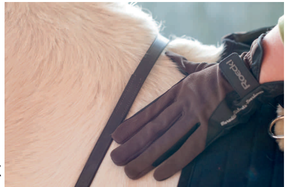
Ob beim Reiten oder der Bodenarbeit - Reithandschuhe sind nützliche Begleiter im Reitsport.

Hat der Reiter eventuell auch noch empfindliche Hände, sodass es ohne Handschuhe schnell zu übler Blasenbildung kommt, sollte in jedem Fall immer zu Handschuhen gegriffen werden. Gefühl erhalten, wärmen, schützen: das ist die Reihenfolge der Relevanz, wenn Reithandschuhe erworben werden. Keine Frage, Griffigkeit und kompromisslos gute Passform sind für den Reiter unverzichtbar. Wenn der Handschuh dann auch noch wärmt und Wasser abweist - prima. Robust, atmungsaktiv und elastisch - man sieht, bei diesem Accessoire wünscht man sich die eierlegende Wollmilchsau. Doch jeder Handschuh erfüllt einen Zweck immer: er schützt. Nicht umsonst legen gewissenhafte Ausbilder großes Augenmerk darauf, dass nicht nur beim Reiten Handschuhe getragen werden. Gerade beim Führen, Anbinden oder Verladen passieren viele Unfälle. Und mal eben durch eine Kopfbewegung den Strick durch die Hände gezogen - das ist selbst für den kleinsten Shetty ein Leichtes. 🐾